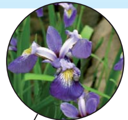
Iris versicolore Iris versicolor