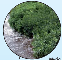
Myrique baumier Myrica gale

Un repère visuel pourrait vous aider lors de vos travaux. Télécharger cette affiche au www.crelaurentides.org/capsules.shtml