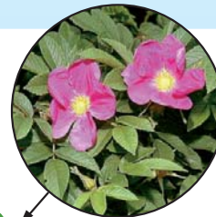
Rosier rustique Rosa rugosa